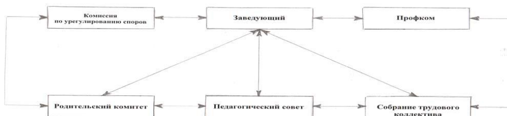
Структура управления ДООУ

В детском саду функционирует Первичная профсоюзная организация.